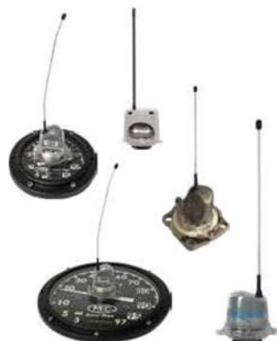
Para diferentes tipos de indicadores (incluindo Rochester Magnetel 4" / 8").